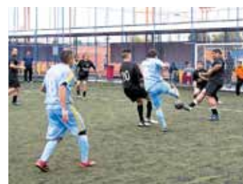
Nasha X Technoveda/Technocap