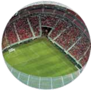
Estádios de futebol