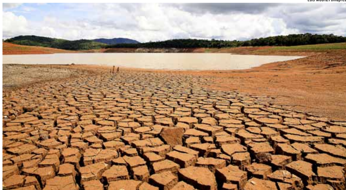
Nível do Cantareira continua em queda, mesmo com a breve chuva e o uso do volume morto

Desde 2004, o governo estadual sabia desse risco e da urgência em ampliar o sistema de abastecimento e reduzir desperdícios, com os frequentes vazamentos nas tubulações, mas não planejou e nem investiu em obras. Em recente debate realizado na Assembleia Legislativa de São Paulo, sobre a “Crise da Água”, a CUT decidiu denunciar a irresponsabilidade do governo tucano de Geraldo Alckmin (PSDB) em relação ao abastecimento e organizar uma grande mobilização. “A Central entrará com ação judicial contra a multa de 30% prevista aos consumido-