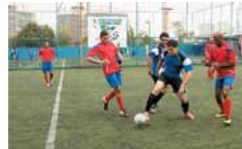
Avon X Nova Vulcão