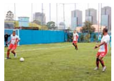
Cária X Althaia