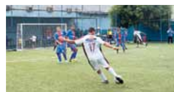
Injectra X Britanite