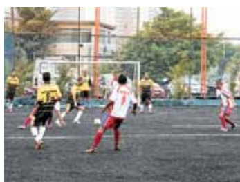
Mazda X MB7