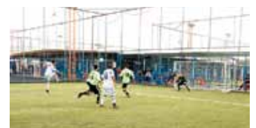
Altaplast X Zaraplast 2