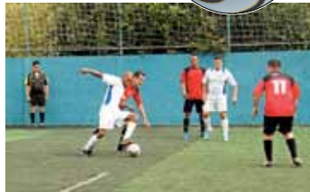
Acrilar X Freedom Cosméticos