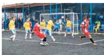
Gávea X Kert Cosméticos