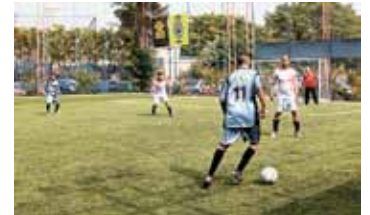
Injecom X Dileta 2